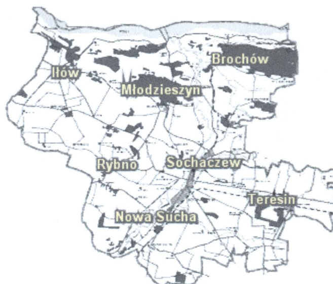
Rys.2 Lokalizacja Gminy Brochów w powiecie sochaczewskim.

Gmina Brochów graniczy z rzeką Wisłą, oraz z gminami: Młodzieszyn, Sochaczew, Kampinos, Leoncin i miastem Sochaczew. Obszar gminy posiada dogodne powiązania komunikacyjne z regionem. Powierzchnia gminy wynosi 117 km 2 i zamieszkuje ją 4300 osób.