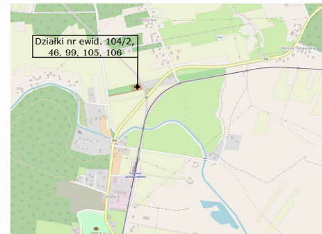
ORIENTACJA 1 : 25 000